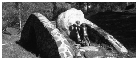
Instal·lació de Marc Brusse a la Ruta del Ferro.