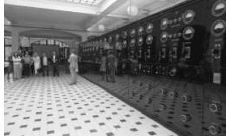
Inauguració de les noves instal·lacions d'Andorra Turisme.

L'itinerari de transformacions de Radio de les Valls, o si ho preferim de Sud Radio, al Pic Blanc, serà totalment diferent. Dèiem que el centre emissor de Radio Andorra és un edifici industrial, que ha pogut conservar la immensa majoria de la seva maquinària, que a més ha conservat fins i tot les seves antenes davant el llac d'Engolasters, que li feia de mirall per fer rebotar les ones i arribar més enllà. Sud Radio és un edifici dels anys 60, construït amb una certa forma de vaixell posat dalt de la muntanya, a una cota de 2.508 m d'alçada, molt simbòlic, en mig d'un gran domini esquiable, que conserva una de les dues antenes que tenia i que s'ha integrat en la imatge de l'estació d'esquí. L'immoble de Sud Radio i els seus entorns immediats canviaran