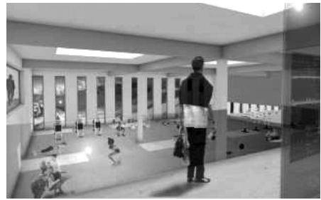
Vista actual de l'espai de producció d'ones al centre emissor de Sud Radio i projecte de transformació en gimnàs.