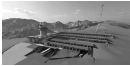
Vista actual del centre emissor de Sud Radio en mig de Granvalira i vista del projecte icònic, de l'empresa Bomosa.

El centre crea al costat de l'edifici central 81 habitacions amb capacitat de fins a 140 persones, amb tres restaurants. A l'edifici històric hi haurà la zona esportiva i wellness , i els espais mèdics i de rehabilitació. També en l'edifici històric hi haurà un espai de memòria, que explicarà el que va ser Radio de les Valls i després Sud Radio.