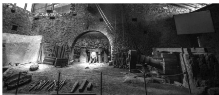
Zona de mall i martinet a la farga Rossell. El cor de la farga.

Era evident que el projecte no podia acabar allà, i es va crear la Ruta del Ferro. Primerament de forma interna, amb el Comú d'Ordino. Es va buidar d'aigua la mina de Llorts, es va excavar i es va obrir al públic. Amb l'àrea de Promoció Cultural es van organitzar dos simpòsiums d'escultura, en què una sèrie d'artistes de caràcter intercultural van interpretar la història de la siderúrgia al país. Després vam iniciar la labelització de la ruta transfronterera amb l'Institut Europeu dels Itineraris Culturals, un organisme amb seu a Luxemburg que forma part del Consell d'Europa. Aquest fet ha anat incorporant instal·lacions siderúrgiques i altres elements relacionats amb la producció del ferro al Pirineu. Andorra s'unia amb Catalunya, Euskadi, Occitània i Aquitània per desenvolupar un itinerari al qual progressivament s'han anat afegint fins a una trentena d'instal·lacions repartides per tota la serralada i a la qual sens dubte es continuaran afegint més i més espais industrials.