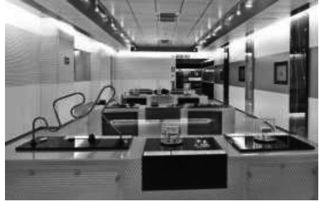
Vista de la Central de FEDA i d'una sala del museu.

Per acabar, voldria tractar el tema de les ràdios. No em refereixo tant als estudis de locució sinó més aviat als centres de producció d'ones, als seus espais i instal·lacions més industrials. La primera cadena de ràdio que s'instal·la al país és Radio Andorra i la segona va ser Radio de les Valls, que més endavant utilitzà la marca Sud Radio, que encara funciona com a FM des de Tolosa de Llenguadoc. El que tractarem aquí no és precisament la producció d'ones en format FM, sinó la producció d'ones a gran escala, les d'ona mitja, curta i llarga, i és que Radio Andorra en certs moments de la seva vida es podia escoltar a bona part d'Europa i fins i tot a Amèrica.