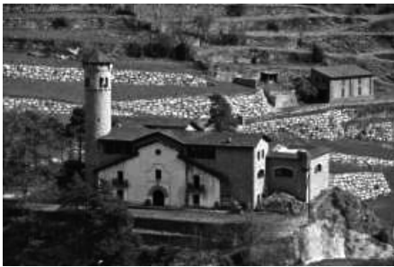
Vista del centre emissor de Radio Andorra durant la restauració.

Per acabar, voldria tractar el tema de les ràdios. No em refereixo tant als estudis de locució sinó més aviat als centres de producció d'ones, als seus espais i instal·lacions més industrials. La primera cadena de ràdio que s'instal·la al país és Radio Andorra i la segona va ser Radio de les Valls, que més endavant utilitzà la marca Sud Radio, que encara funciona com a FM des de Tolosa de Llenguadoc. El que tractarem aquí no és precisament la producció d'ones en format FM, sinó la producció d'ones a gran escala, les d'ona mitja, curta i llarga, i és que Radio Andorra en certs moments de la seva vida es podia escoltar a bona part d'Europa i fins i tot a Amèrica.