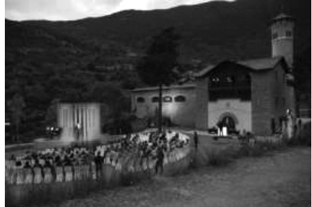
Imatge d'un acte als jardins de Radio Andorra.