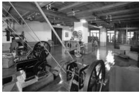
Espais de l'antic Museu del Tabac.