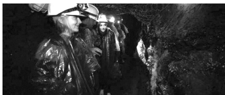
Visita a la mina de Llorts.

Pel que fa a Andorra, la ruta, que té l'obligació donada pel Consell d'Europa d'ampliar-se in eternum , ha iniciat altres projectes. El més interessant és l'excavació, estudi, restauració i interpretació de la farga del Madriu. Es tracta d'un projecte d'enveja, dirigit per O. Codina, amb